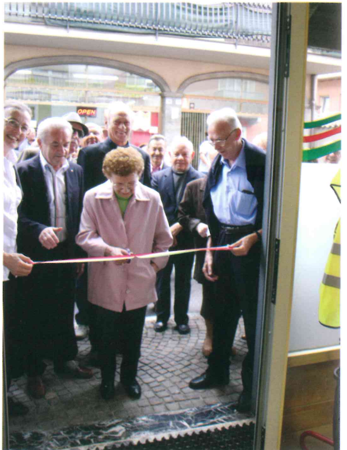
Inaugurazione sede Bolgare