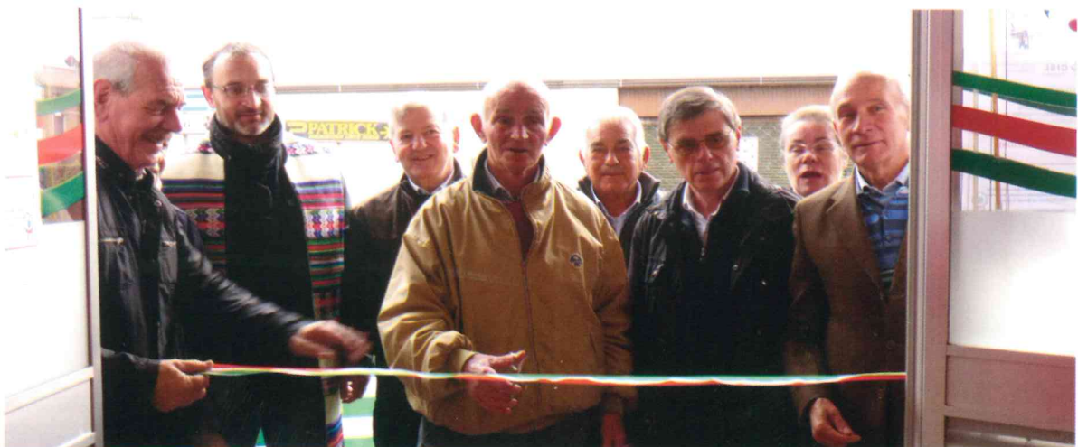
Inaugurazione sede Cisano