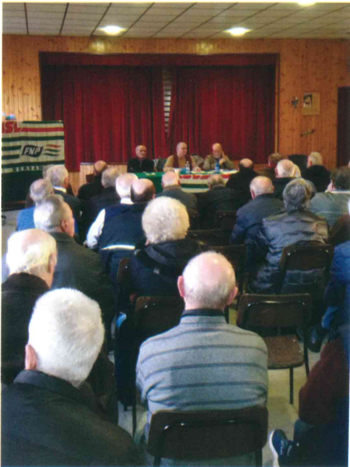
Assemblea Costa Volpino