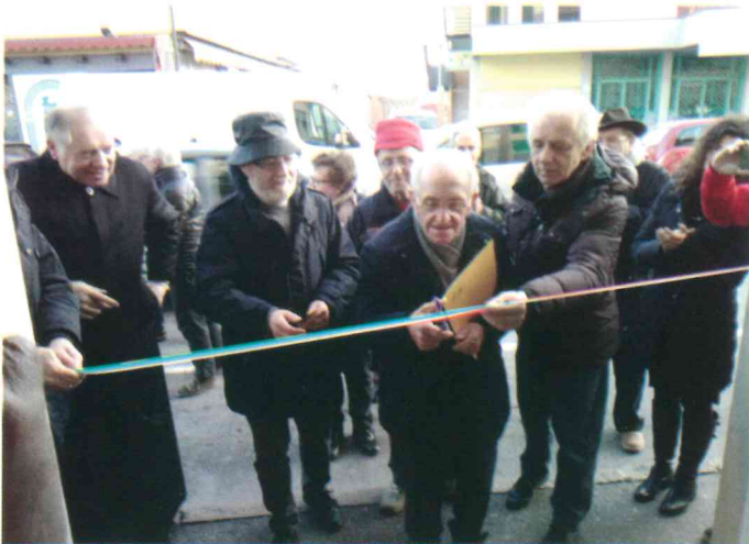
Inaugurazione sede Urgnano